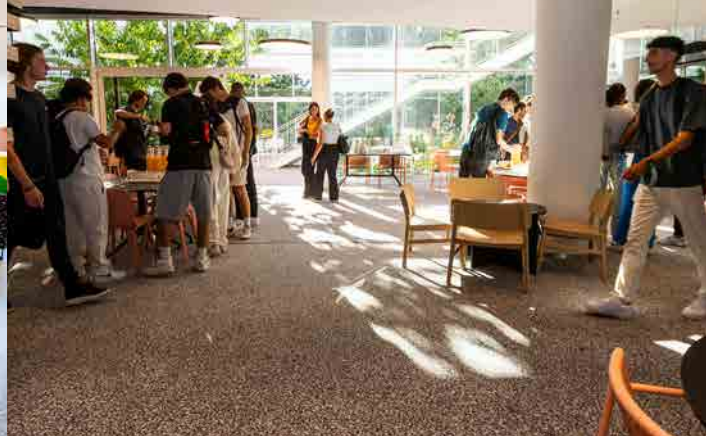
CAMPUS SAINT-GERMAIN-EN-LAYE (à 40 mn du centre de Paris en RER).