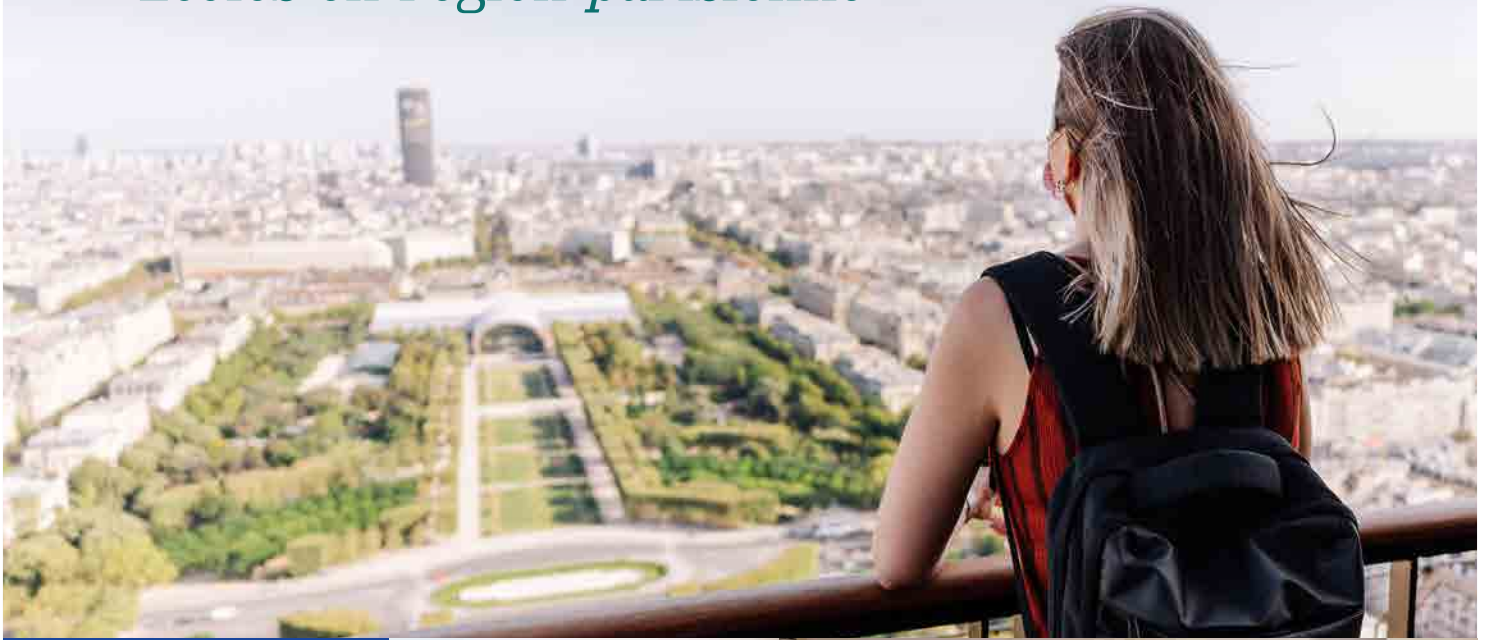
CAMPUS AUDENCIA PARIS S'-OUEEN